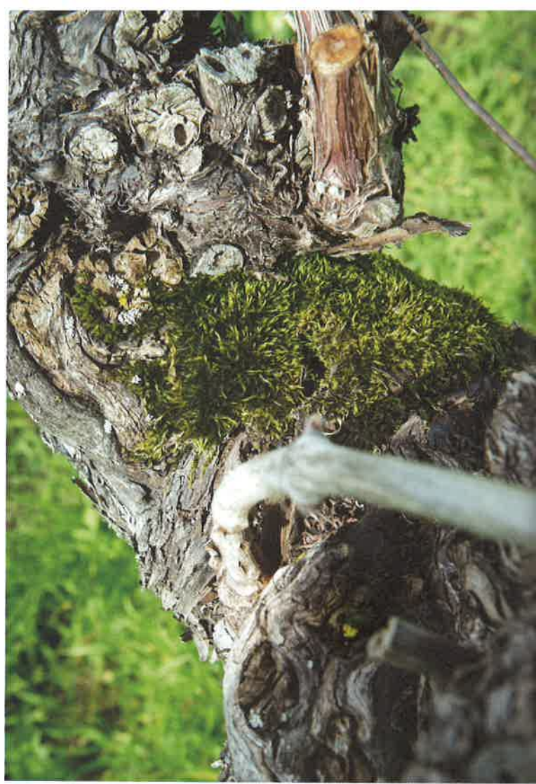
Einer der wichtigsten Schätze des Betriebs sind alte Reben