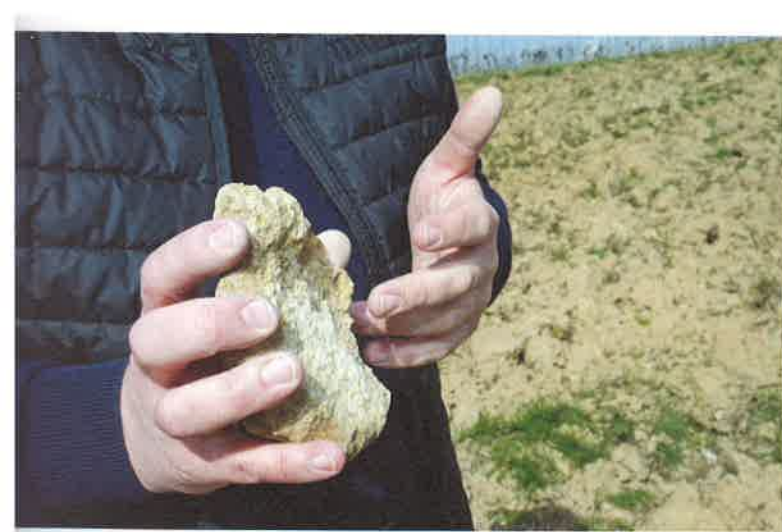
Kalkig, kalkig: Das Selztafel verleiht Burgundern, Riesling & Co. viel Ausdruck