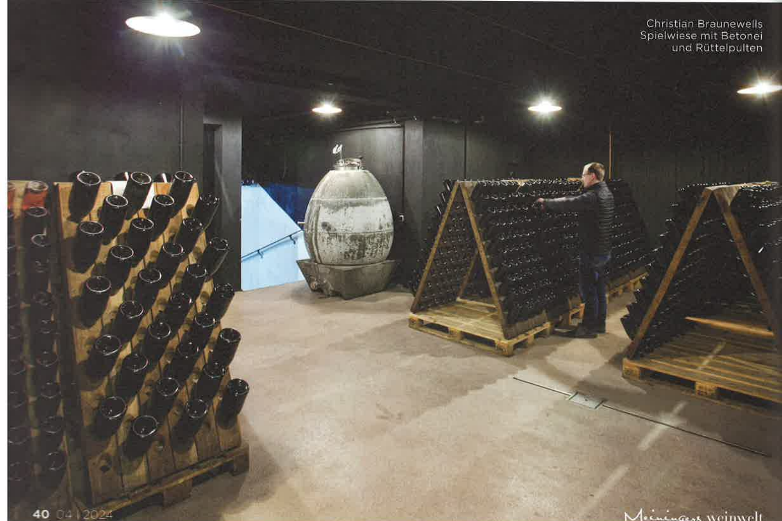
Christian Braunewells Spielwiese mit Betonei und Rüttelpulten