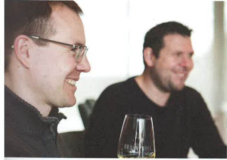
Braunewell-Brüder ergänzen sich und arbeiten Hand in Hand